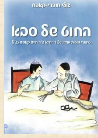
חורר סבא ספר מאת חורר סבא ודוד בן דוד